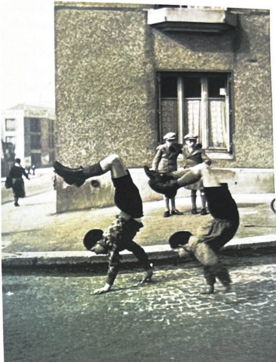
Robert Doisneau, Les frères rue du docteur Lecène , 1934