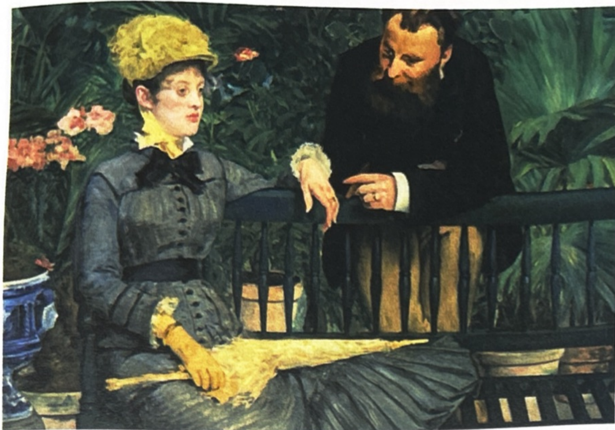
Edouard Manet, Dans la Serre , 1878