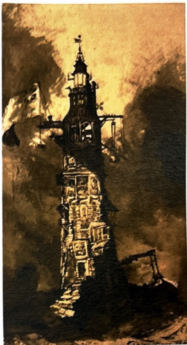
Le phare d'Eddystone, 1866 de Victor Hugo (parce qu'il ne faisait pas qu'écrire)