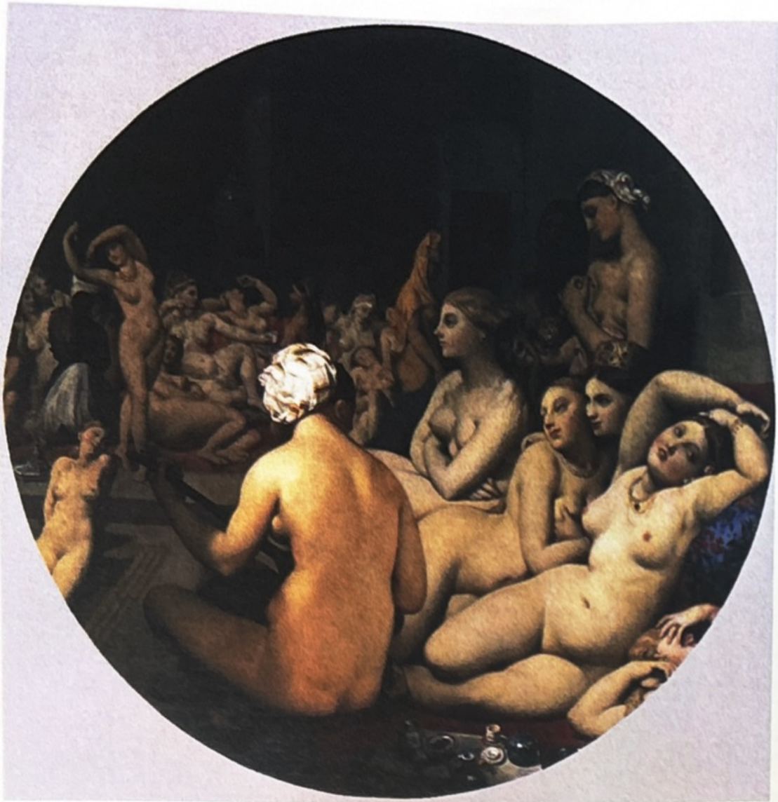
Le bain turc, 1862 de Ingres