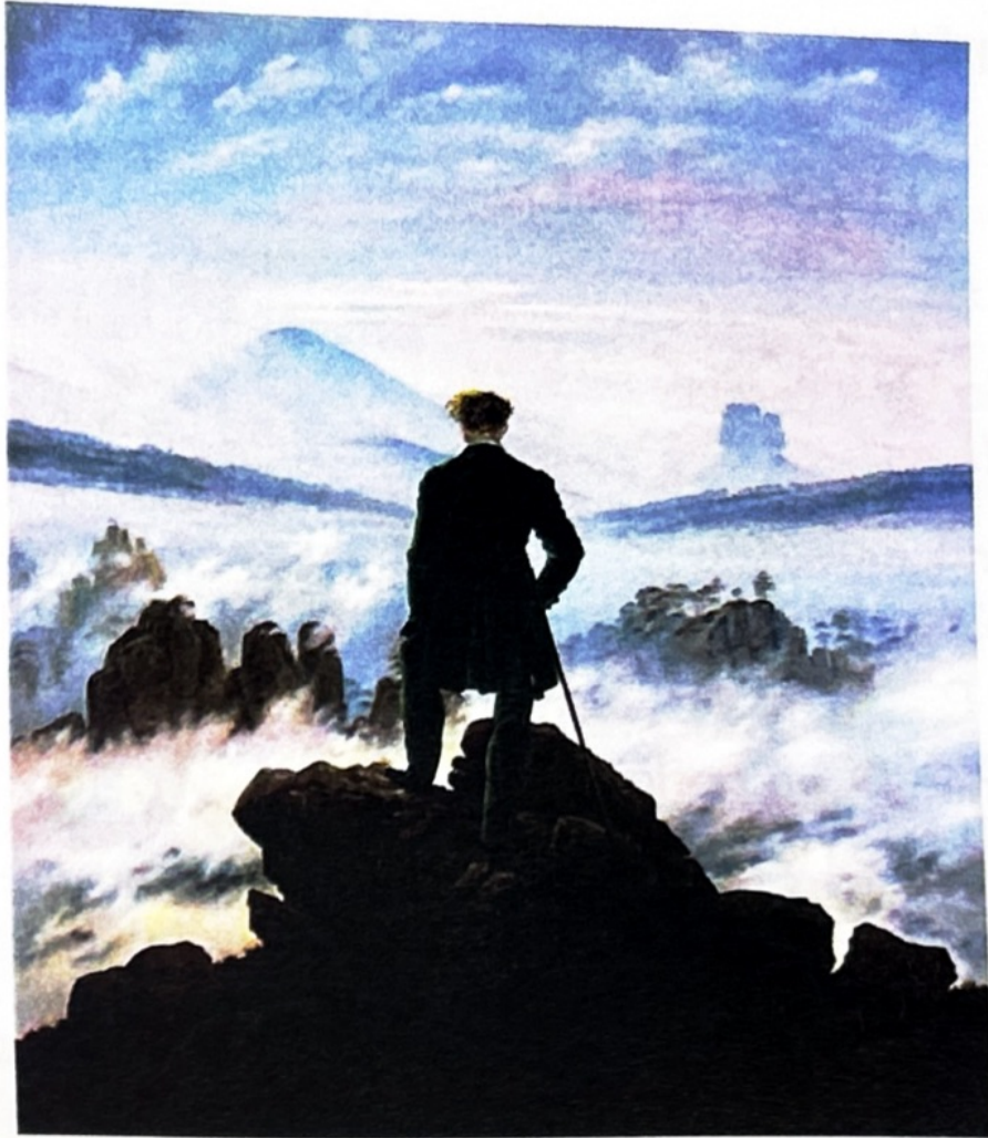
Le Voyageur contemplant une mer de nuages / Der Wanderer über dem Nebelmeer, 1818 de Caspar David Friedrich